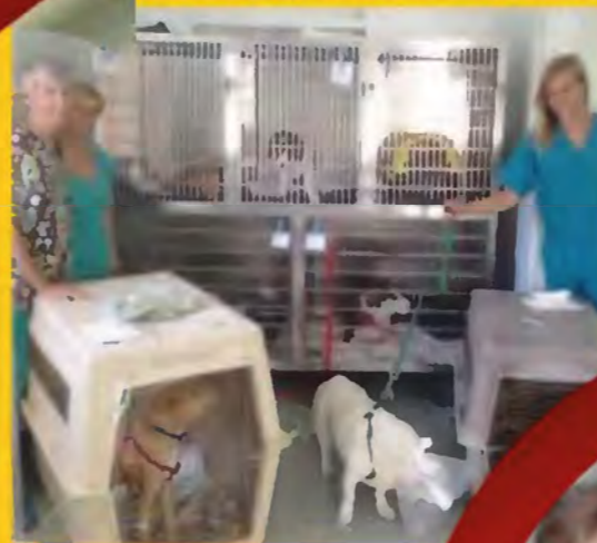
KASTRATIONSTAG IN ROCCA D'EVANDRO