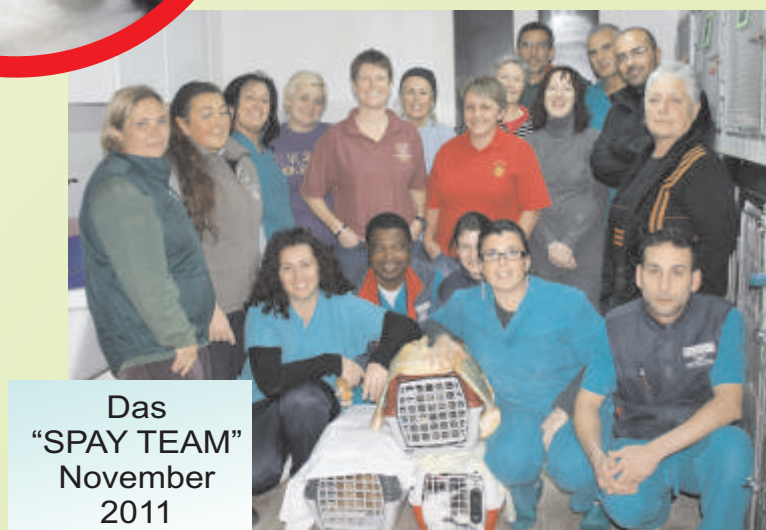
Das "SPAY TEAM" November 2011

SIE LIEBEN TIERE? SIE SIND (FRUEH)RENTNER(IN) UND NOCH SEHR AKTIV? SIE WOLLTEN SCHON IMMER "IM SUEDEN" LEBEN? WARUM KOMMEN SIE NICHT ZU UNS? WIR BIETEN EINEN EINGERICHTETEN CONTAINER (2 KLEINE ZIMMER/KUECHE/DUSCHE/WC/HEIZUNG) IN UNSEREM ZENTRUM GEGEN LEICHTE HAUSMEISTERARBEITEN. WIR KOENNEN LEIDER AUS FINANZIELLEN GRUENDEN NIEMANDEN MEHR EINSTELLEN UND KEINE VERSICHERUNGEN MEHR BEZAHLEN.