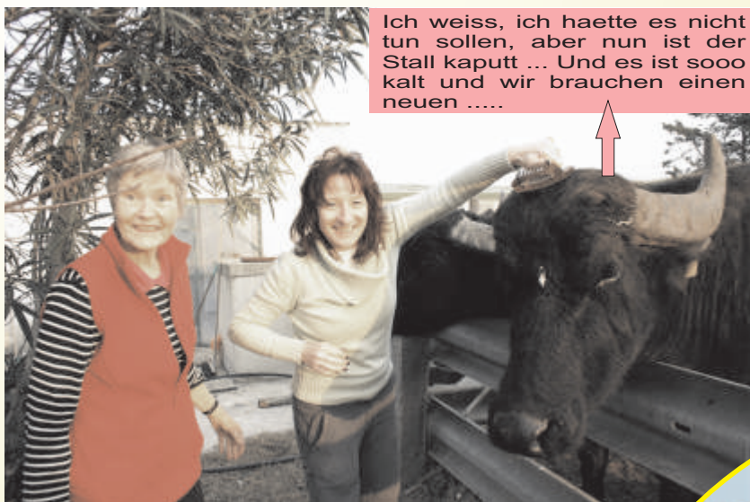
Ich weiss, ich haette es nicht tun sollen, aber nun ist der Stall kaputt ... Und es ist sooo kalt und wir brauchen einen neuen .....