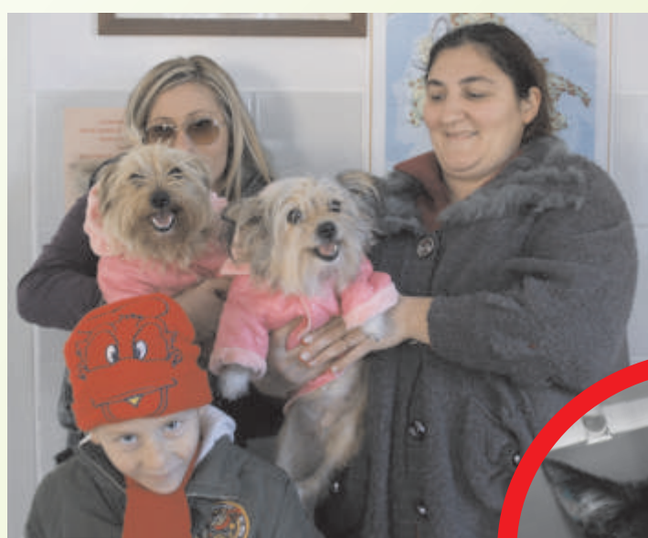
Zwei von der LPA vermittelte Yorkie-Mischlinge kommen zum Impfen in die Klinik - in "schicken" Anzuegen ....